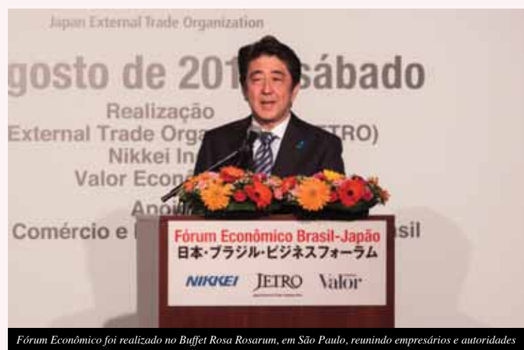
Fórum Econômico foi realizado no Buffet Rosa Rosarum, em São Paulo, reunindo empresários e autoridades