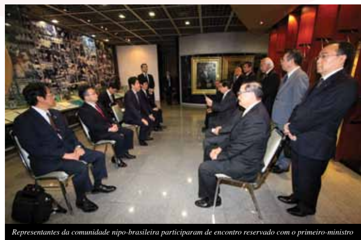
Representantes da comunidade nipo-brasileira participaram de encontro reservado com o primeiro-ministro