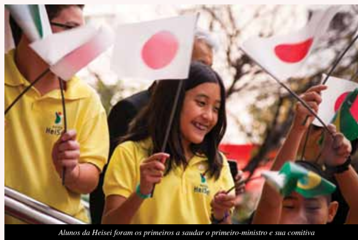
Alunos da Heisei foram os primeiros a saudar o primeiro-ministro e sua comitiva

Professor Universitário. Mestre e Doutorando em Relações Internacionais (UNESP/UNICAMP/PUC-SP). Ex-aluno da Aliança Cultural Brasil-Japão.