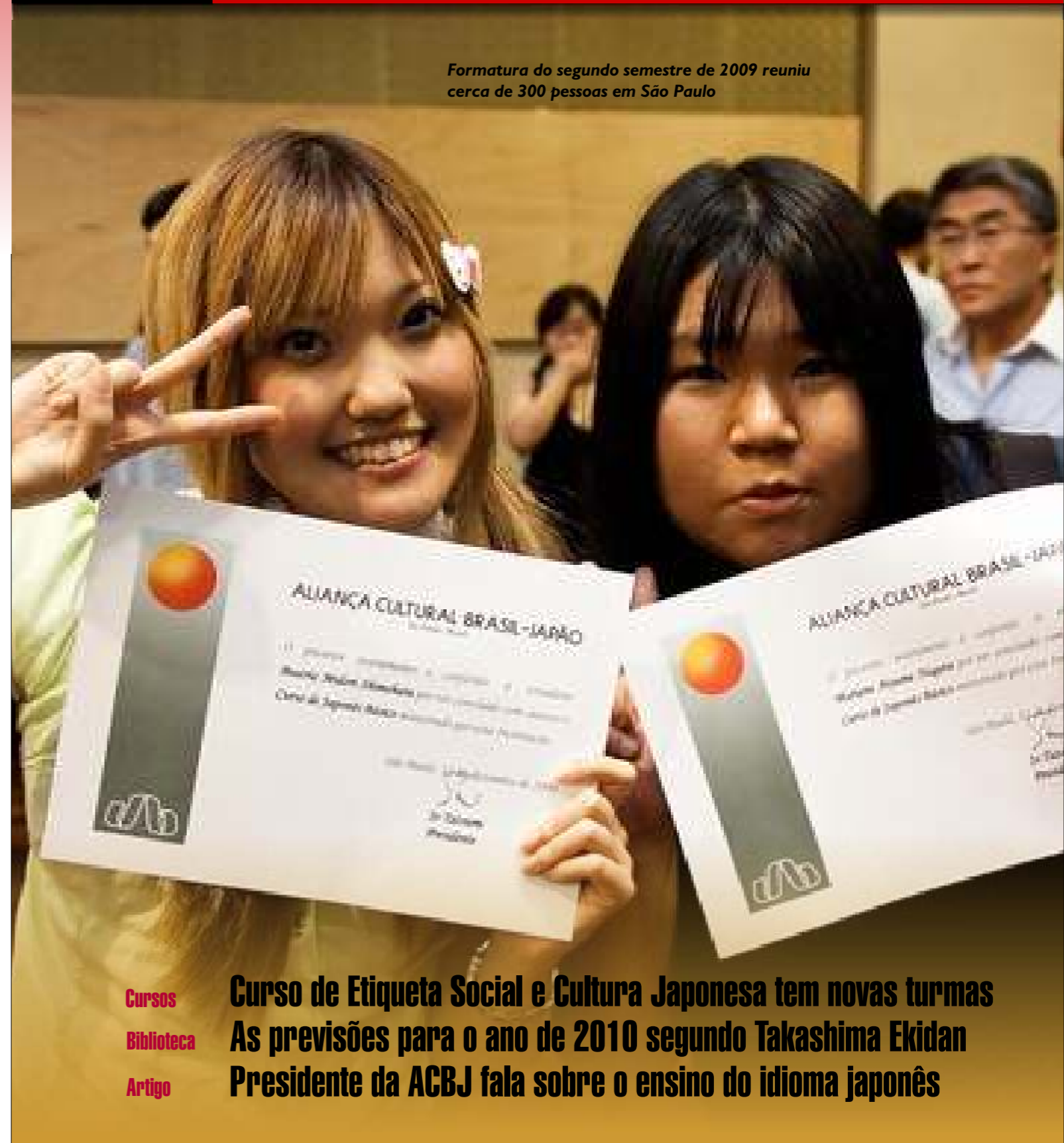
Formatura do segundo semestre de 2009 reuniu cerca de 300 pessoas em São Paulo