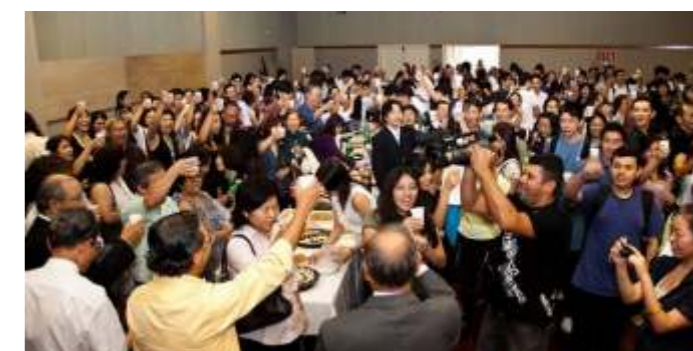
Hora do brinde após o encerramento da cerimônia