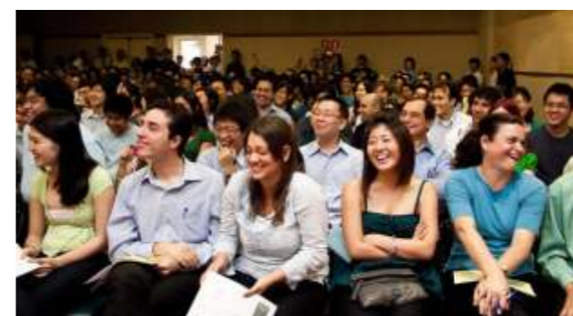
Público presente à cerimônia de formatura