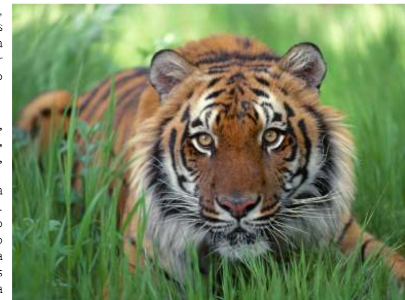
2010 é o Ano do Tigre no horóscopo chinês

Goou Dosei: 2004, 1995, 1986, 1977, 1968, 1959, 1950, 1941, 1932, 1923, 1914