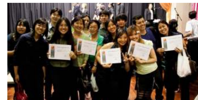
... o recebimento do diploma