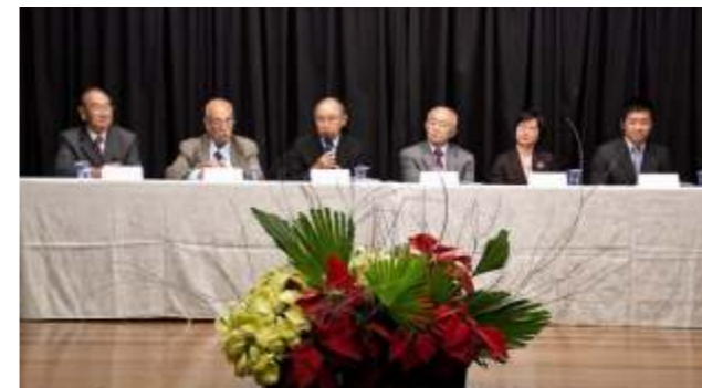
Composição da mesa oficial da cerimônia de abertura

A programação foi encerrada com três apresentações. A primeira parte foi destinada ao coral da Aliança Cultural Brasil-Japão, seguido pelos formandos do curso Básico e finalizando com os formandos dos cursos Intermediário, Pré-Intermediário, Avançado e Português.