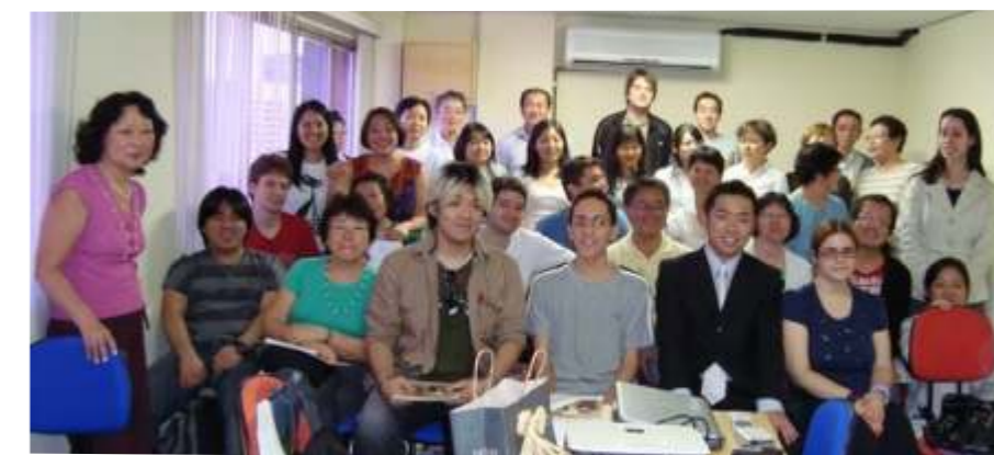
Alunos do Avançado ampliaram repertório de termos japoneses na palestra