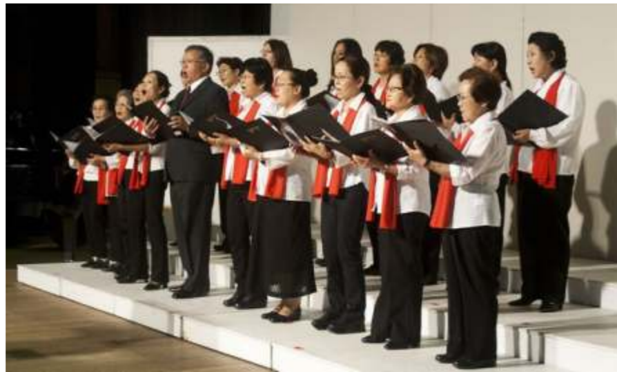
43ª edição do Festival de Canto Coral foi uma das realizações da ACBJ em 2009