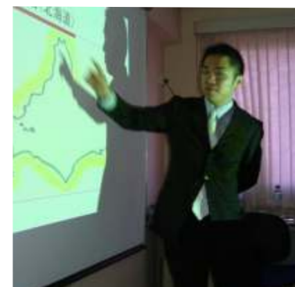
Takahashi abordou a hospitalidade e gentileza do povo japonês

O turismo no Japão tem aumentado a cada ano que passa. Atualmente, o Brasil ocupa a 1ª posição na América Latina, em números de visitantes ao Japão, com 20.981 turistas anuais.