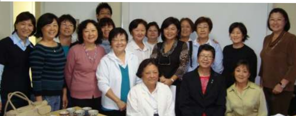
Nas fotos, os alunos da primeira turma do curso de Etiqueta Social e Cultura Japonesa

Em março, a Aliança inicia novas turmas do curso. Informações e inscrições pelo email alianca@aliancacultural.org.br .